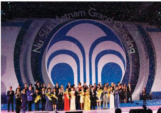
Ban Lãnh Đạo Nu Skin cùng với các Nhà Phân Phối tại Lễ khai trương Nu Skin Enterprises tại Việt Nam

Nu Skin được thành lập bởi doanh nhân và dành cho doanh nhân. Từ bước khởi đầu vào năm 1984, Nu Skin luôn gắn bó với sứ mệnh cải thiện cuộc sống của con người. Tư tưởng này đã giúp chúng tôi phát triển các giải pháp chống lão hóa hàng đầu, bày tỏ tình thương yêu đối với mọi trẻ em trên toàn cầu, cũng như mở ra cánh cửa cơ hội cho những người mong muốn theo đuổi mục tiêu về lối sống và tài chính của họ.