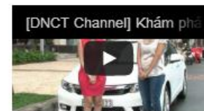
Trải nghiệm Honda Civic 2012