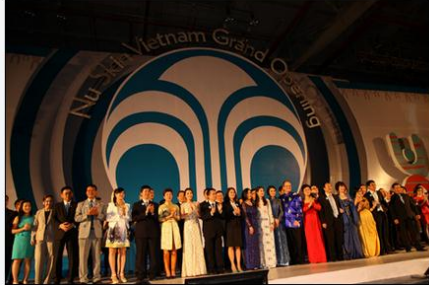
Ban lãnh đạo Nu Skin cùng với các nhà phân phối tại lễ khai trương Nu Skin Enterprises tại Việt Nam.

Từ bước khởi đầu này, hiện Nu Skin đã phát triển thành một công ty bán hàng trực tiếp và phân phối hơn 200 sản phẩm chống lão hóa chất lượng cao, trong lĩnh vực chăm sóc cá nhân và thực phẩm bổ sung, tạo ra doanh thu hơn 2,17 tỷ USD trong năm 2012. Nu Skin hoạt động tại 53 thị trường quốc tế tại châu Mỹ, châu Á Thái Bình Dương, châu Âu, châu Phi và Trung Đông.