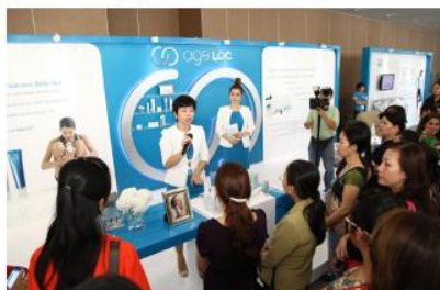
Hàng nghìn nhà phân phối và khách tham quan các gian hàng trưng bày và giới thiệu sản phẩm Nu Skin tại lễ khai trương Nu Skin Enterprises ở Việt Nam.

Tại sự kiện này, công ty đã giới thiệu về các sản phẩm chăm sóc cá nhân và thực phẩm dinh dưỡng của Nu Skin. Nhân dịp này, công ty đã đóng góp vào quỹ từ thiện của tổ chức Đông Tây Hội Ngộ (East Meets West) với số tiền 200 triệu đồng trích từ quỹ "Đội ngũ làm vì những điều tốt đẹp của Nu Skin (Nu Skin Force For Good Foundation). Khoản quyên góp này sẽ được dùng trực tiếp cho việc trợ giúp các trẻ em bị bệnh tim bẩm sinh tại Việt Nam.