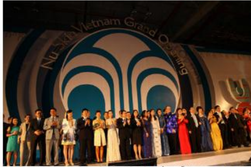
Ban lãnh đạo Nu Skin cùng với các nhà phân phối tại lễ khai trương Nu Skin Enterprises tại Việt Nam.

Từ bước khởi đầu này, hiện Nu Skin đã phát triển thành một công ty bán hàng trực tiếp và phân phối hơn 200 sản phẩm chống lão hóa chất lượng cao, trong lĩnh vực chăm sóc cá nhân và thực phẩm bổ sung, tạo ra doanh thu hơn 2,17 tỷ USD trong năm 2012. Nu Skin hoạt động tại 53 thị trường quốc tế tại châu Mỹ, châu Á Thái Bình Dương, châu Âu, châu Phi và Trung Đông.