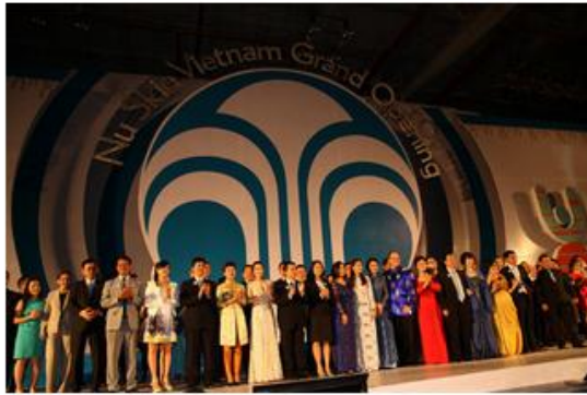
Ban lãnh đạo Nu Skin cùng với các nhà phân phối tại lễ khai trương Nu Skin Enterprises tại Việt Nam.

Tại châu Á Thái Bình Dương, việc chăm sóc sức khỏe cá nhân đang ngày càng phát triển. Với mức thu nhập ngày càng cao và nhiều lựa chọn hơn về các sản phẩm trên thị trường, người tiêu dùng Việt Nam ngày càng chú trọng hơn đến việc chăm sóc bản thân và lựa chọn những giải pháp thích hợp để phục vụ mục đích đó. Với dân số hơn 90 triệu người, thị trường tại đây hứa hẹn nhu cầu lớn cho các giải pháp chống lão hóa.