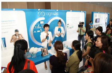
Hàng nghìn nhà phân phối và khách tham quan các gian hàng trưng bày và giới thiệu sản phẩm Nu Skin tại lễ khai trương Nu Skin Enterprises ở Việt Nam.

“ Tại sự kiện này, công ty đã giới thiệu về các sản phẩm chăm sóc cá nhân và thực phẩm dinh dưỡng của Nu Skin. Nhân dịp này, công ty đã đóng góp vào quỹ từ thiện của tổ chức Đông Tây Hội Ngộ (East Meets West) với số tiền 200 triệu đồng trích từ quỹ "Đội ngũ làm vì những điều tốt đẹp của Nu Skin (Nu Skin Force For Good Foundation). Khoản quyền góp này sẽ được dùng trực tiếp cho việc trợ giúp các trẻ em bị bệnh tim bẩm sinh tại Việt Nam.