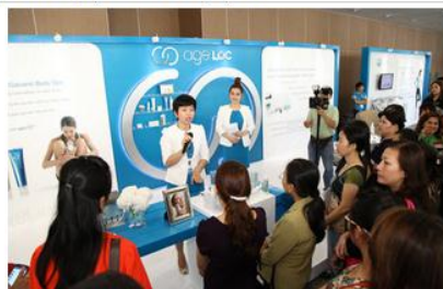
Hàng nghìn nhà phân phối và khách tham quan cáo gian hàng trưng bày và giới thiệu sản phẩm Nu Skin tại lễ khai trương Nu Skin Enterprises ở Việt Nam.

Tại sự kiện này, công ty đã giới thiệu về các sản phẩm chăm sóc cá nhân và thực phẩm dinh dưỡng của Nu Skin. Nhân dịp này, công ty đã đóng góp vào quỹ từ thiện của tổ chức Đông Tây Hội Ngộ (East Meets West) với số tiền 200 triệu đồng trích từ quỹ "Đội ngũ làm vì những điều tốt đẹp của Nu Skin (Nu Skin Force For Good Foundation). Khoản quyền góp này sẽ được dùng trực tiếp cho việc trợ giúp các trẻ em bị bệnh tim bẩm sinh tại Việt Nam.